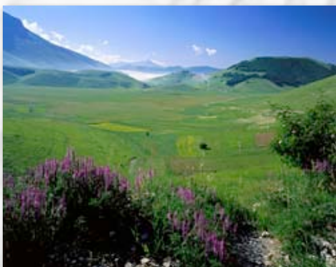
Tipico paesaggio Umbro

L'Umbria, regione del centro Italia che la ospita, non è solamente la terra di San Francesco, Santa Chiara e San Benedetto da Norcia, ma è diventata anche polo di attrazione turistico-spirituale per moltissimi gruppi interessati alla meditazione, al dialogo interreligioso e alla Pace come strumento di convivenza civile. Tutta la regione infatti accoglie esperimenti di convivenze alternative, comunità che si sono date regole specifiche di vita orientandosi verso la sostenibilità ecologica, la spiritualità e la semplicità. Il territorio, negli ultimi trent'anni, ha dato vita con grande successo ad una produzione culturale di rilevanza internazionale (si veda Umbria Jazz Festival o Festival dei Due Mondi di Spoleto), anche grazie ai network culturali creati dall'Università per Stranieri di Perugia, fondamentali per garantire una vivacità culturale e intellettuale.