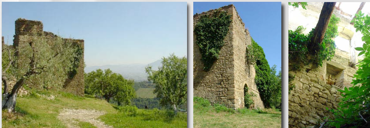
Fig. 2 Visualizzazione del monastero

Il complesso delle Officine includerà anche un Monastero , classificato come “edificio rurale di pregio”, situato a una distanza di circa 100 metri dal Centro Polifunzionale, sulla parte nord-est della proprietà. Si presta naturalmente allo sviluppo delle attività del polo Crescere, e in particolare alla programmazione “Educazione al dialogo, alla consapevolezza ed alla Pace” del Centro Educativo. Potrà anche essere sede di eventi organizzati nell'ambito delle attività delle Officine.